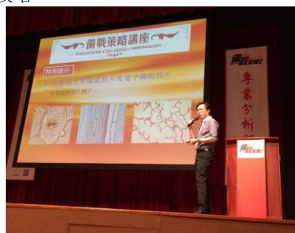
大型備戰策略講座

* 所有收費以收費證明書所列為準，差額(如有)由遵理學校助學基金及有關講師資助。