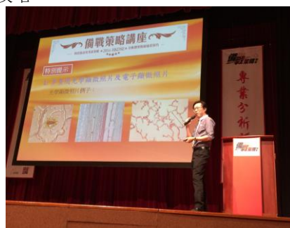
大型備戰策略講座

* 所有收費以收費證明書所列為準，差額(如有)由遵理學校助學基金及有關講師資助。