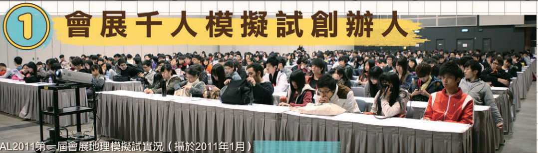
AL2011第一屆會展地理模擬試實況 (攝於2011年1月)