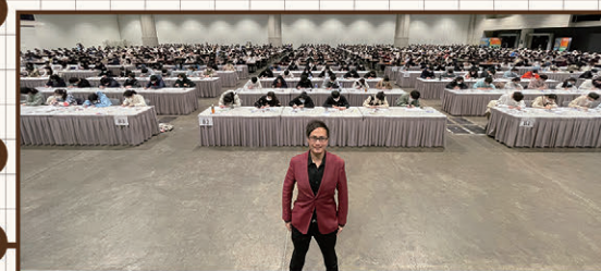
30/12/22 會展Hall 5G