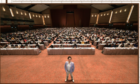
28/12/19 會展Grand Hall