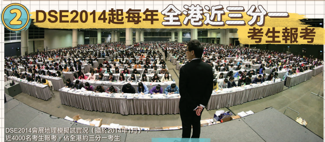
DSE2014會展地理模擬試實況 (攝於2014年1月) 近4000名考生報考, 佔全港約三分之一考生