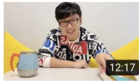
經濟學如何看待發難財。天災人禍後，物資應唔應該加價？ 435 views · 5 months ago