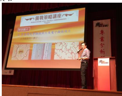
大型備戰策略講座

* 所有收費以收費證明書所列為準，差額(如有)由遵理學校助學基金及有關講師資助。