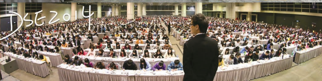
全港近三分之一(近4000位)考生報考，破盡紀錄