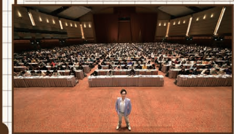
28/12/19 會展Grand Hall