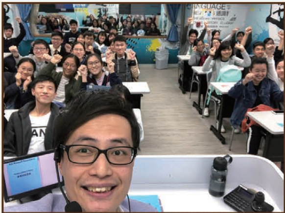
歷年S.6最後一堂合照