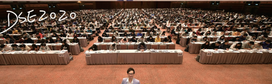
首次同日於會展Grand Hall及九展展貿廳舉辦模擬試