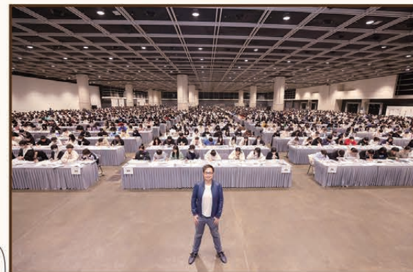
第十五屆會展地理模擬試2024 29/12/23 會展Hall 5F+5G