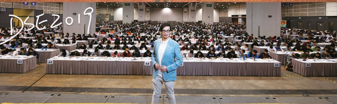
第十屆會展地理模擬試：十年經驗，盡顯專業