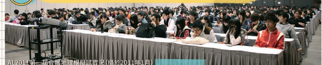
AL2011第一屆會展地理模擬試實況(攝於2011年1月)