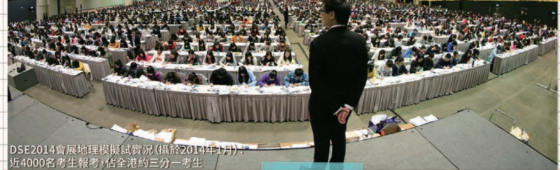
DSE2014會展地理模擬試實況(攝於2014年1月): 近4000名考生報考,佔全港約三分之一考生