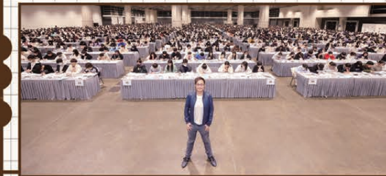
29/12/23 會展Hall 5F+5G