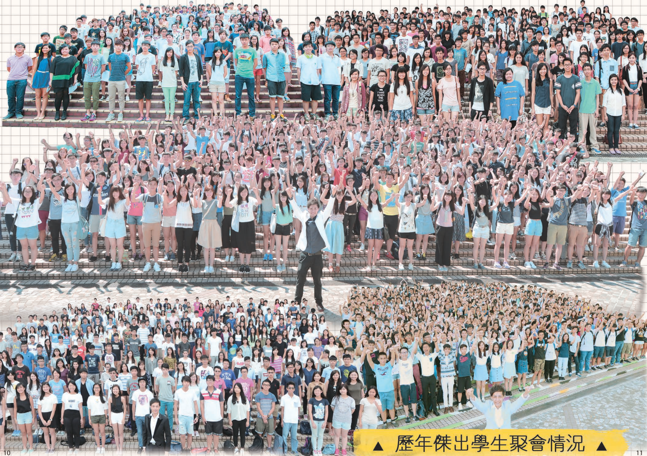
▲ 歷年傑出學生聚會情況 ▲