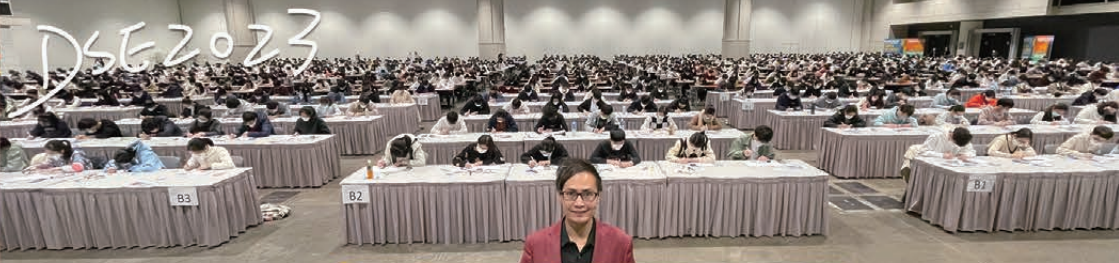
疫情下會展模擬試