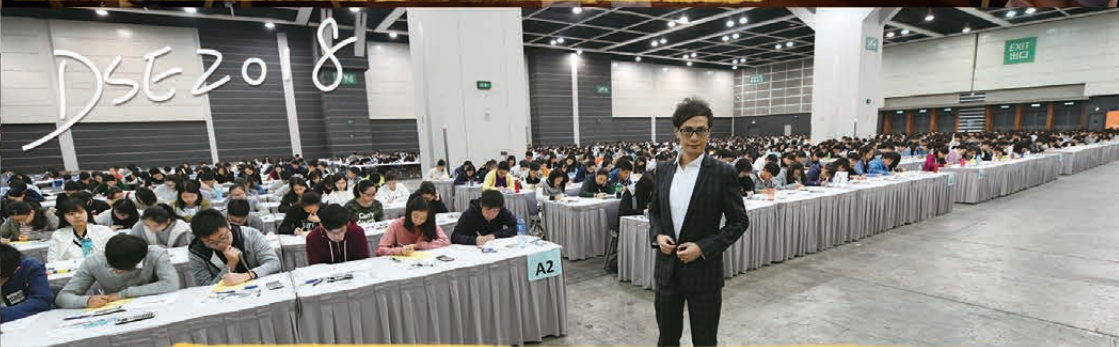
連續五年全港近三分一考生報考