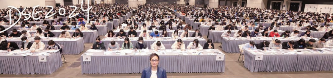
連續十年獲全港近三分一考生報考