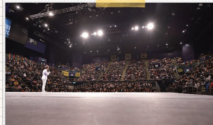
3. 分享答題技巧和奪星關鍵