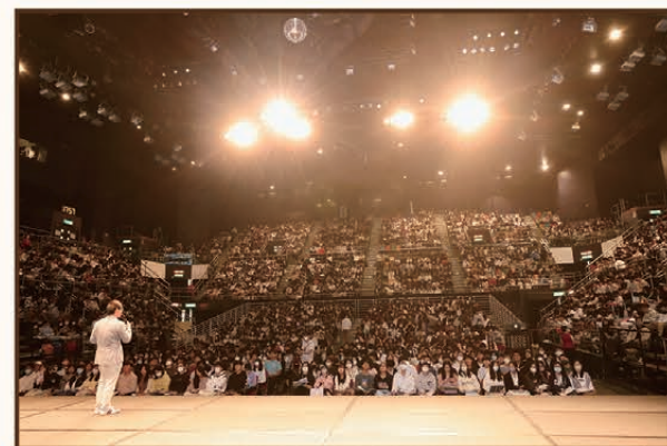
第十五屆會展地理模擬試2024試後分析 01/01/24 伊利沙伯體育館表演場