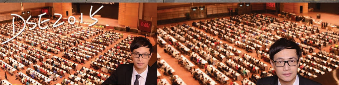
DSE 2015進駐會展大會堂 (Grand Hall)