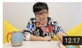
經濟學如何看待發難財。天災人禍後，物資應唔應該加價？ 435 views · 5 months ago