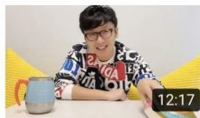
經濟學如何看待發難財。天災人禍後，物資應唔應該加價？ 435 views · 5 months ago