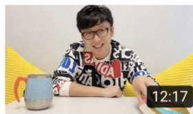
經濟學如何看待發難財。天災人禍後，物資應唔應該加價？ 435 views · 5 months ago