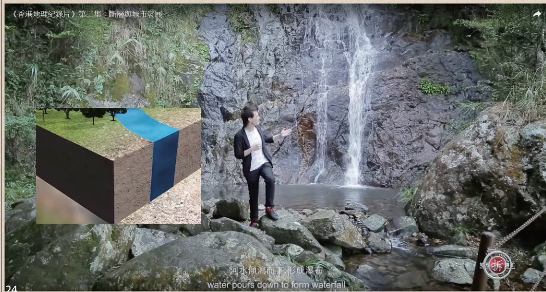
河水傾瀉而下形成瀑布