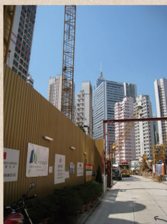
攝於2009年：重建進行中