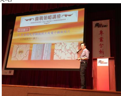
大型備戰策略講座

* 所有收費以收費證明書所列為準，差額(如有)由遵理學校助學基金及有關講師資助。