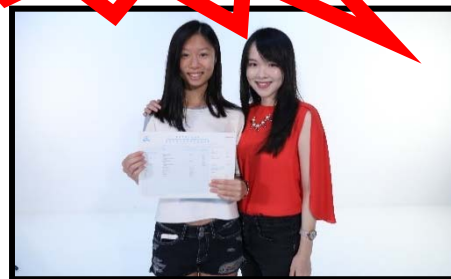
庇理羅士女子中學 5★★