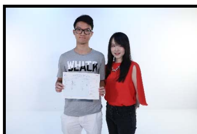
聖公會呂明才中學 5★★