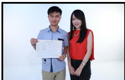
新界鄉議局元朗區中學 5★★