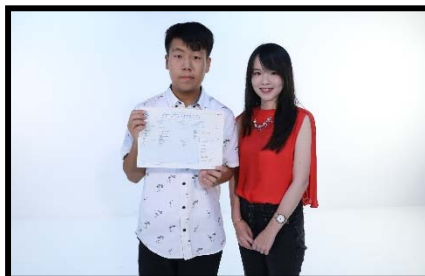
保良局姚連生中學 5★★