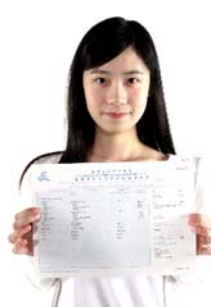
國際基督教優質音樂中學 5★★